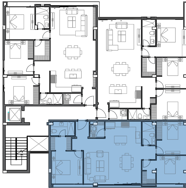
PLANTA 2º Piso Alto