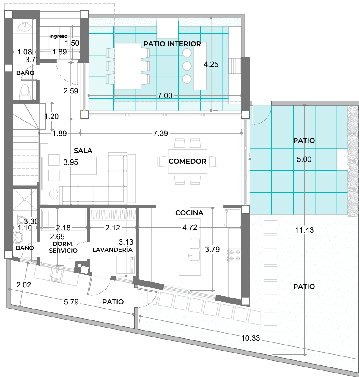
PLANTA BAJA Área: 104.60 m 2