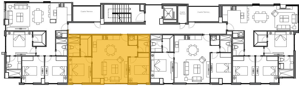
PLANTA 2 do PISO ALTO 429.40 m 2